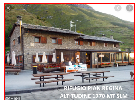
Rifugio ristorante Pian Regina