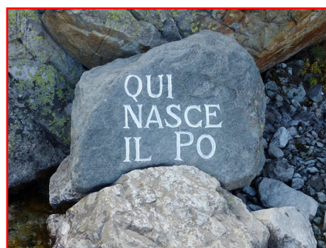
La sorgente del Po