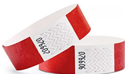
BRACCIALETTA DA POLSO

Il parco assistenza viene aperto alle ore 07.00 di Sabato 27 giugno. Arrivati davanti all'area Accreditamento-Triage le persone incaricate all'assistenza delle vetture e che hanno preventivamente inviato all'organizzazione l'autocertificazione (solo quelle) devono presentarsi con un documento di identità per il controllo e la rilevazione della temperatura corporea. Se tutto è regolare verrà consegnata ad ogni responsabile di Team una busta con all'interno i numeri identificativi delle vetture da apporre, TASSATIVAMENTE, sui due vetri laterali posteriori. A ogni addetto ai lavori, iscritto nell'elenco delle autocertificazioni, verrà consegnato un braccialetto da polso per poter essere identificato.