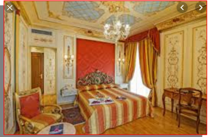
HOTEL REGINA PALACE vista hotel e appartamenti