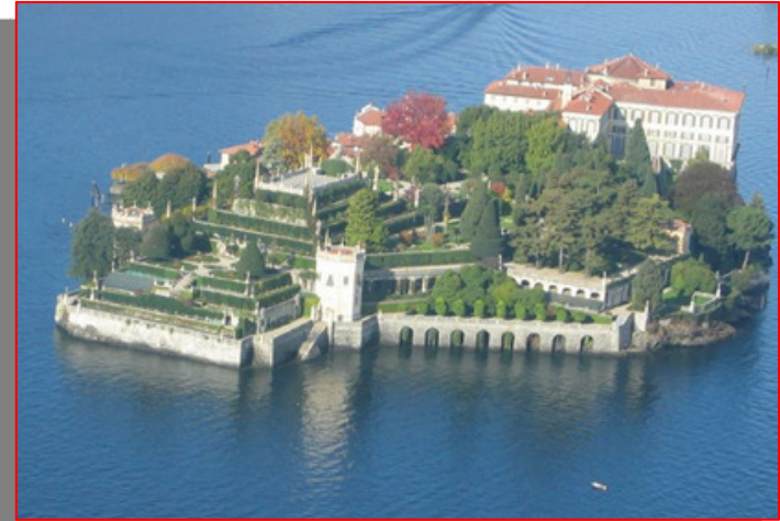
STRESA vista isolabella e palazzo borromeo