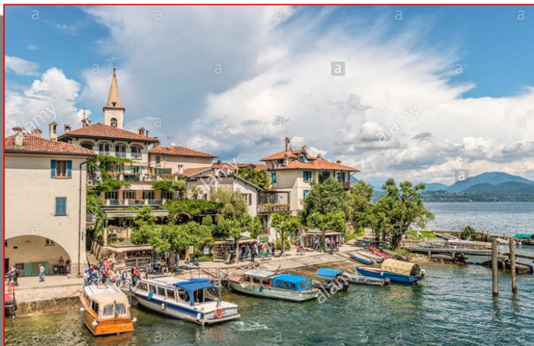
STRESA vista isola dei pescatori