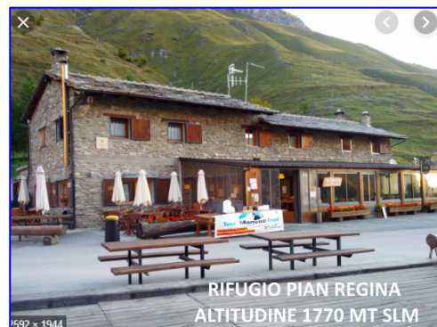
rifugio pian regina 1770 mt slm